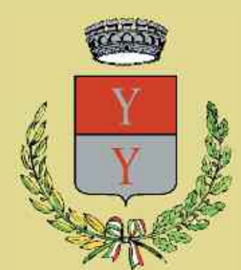
Stemma del Comune di Iseo

residence. A small open gallery with fourteen arches supported by stone columns was added on the east face and a decoration was frescoed on the wall just under the roof. There is no more evidence of a coat of arms in stone of the family Sala mentioned in some documents of the XIX century. Some renovating changes dating back to the XVI century are visible in the internal court which has also a well, a porch and an open gallery. The castle was later divided among various families. In 1641 the families Soncini, Maggi, Coradelli and Lana were the owners of the castle. Each family changed its part of the building according to its own necessities so that it lost its main military features.